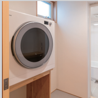
ガス衣類乾燥機「乾太くん」